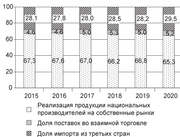
Рис. 3. Структура рынка продукции обрабатывающей промышленности ЕАЭС, 2015–2020 гг., %