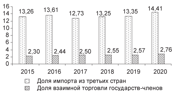
Рис. 4. Соотношение импорта промежуточных товаров во внешней торговле, объема взаимной торговли промежуточными товарами государствами – членами ЕАЭС и объема производства продукции обрабатывающей промышленности, %