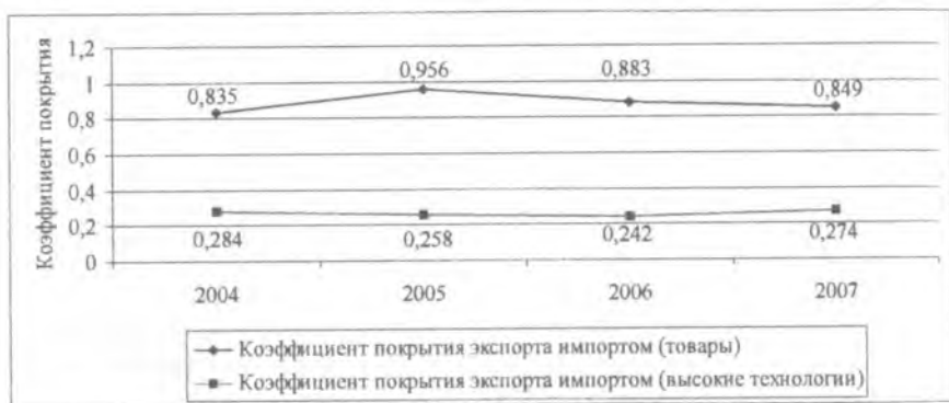
Рис. 1. Соотношение коэффициентов покрытия экспорта импортом по всем товарам и по высоким технологиям в динамике

Вместе с тем, разрыв между указанными показателями в динамике растет (с 2,9 раза в 2004 г. до 3,1 в 2007 г.), что видно из рис. 1.