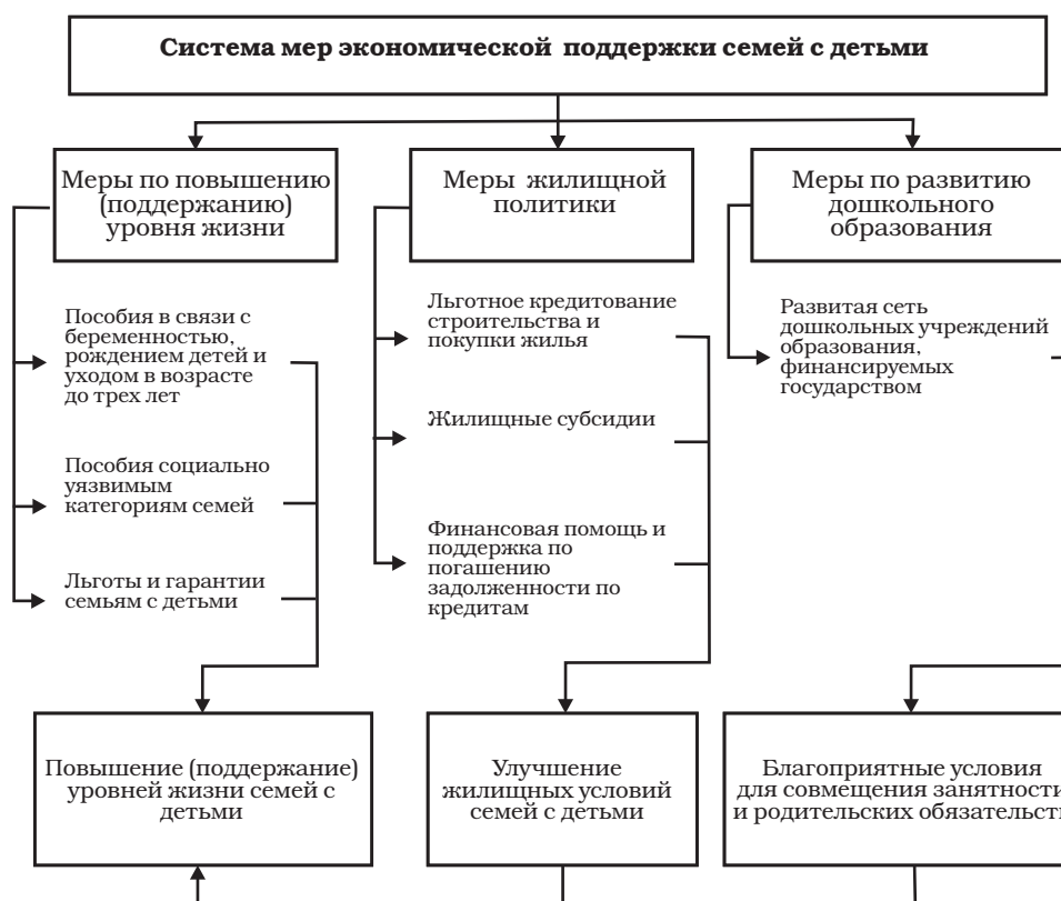
Рис. 1. Основные элементы системы мер экономической поддержки семей с детьми в Республике Беларусь

меры по развитию дошкольного образования (рис. 1).