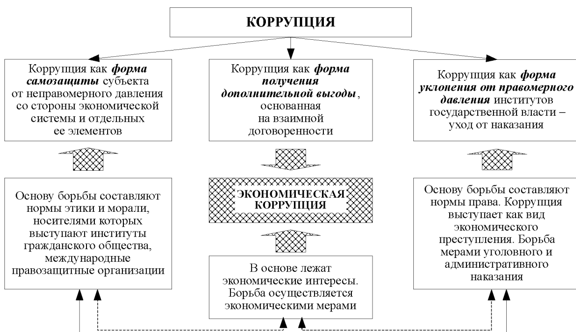
Рис. 1. Формы коррупции.

даче ему всей (части) материальной или нематериальной выгоды.