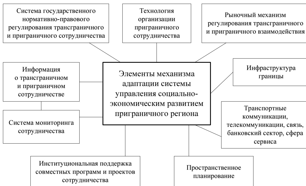
Рис. 1. Элементы механизма адаптации системы управления приграничным регионом.

На приграничной территории через развитие приграничных связей происходит адаптация и частичная реализация взаимных интересов сопредельных государств. На основе выявления и систематизации воз-