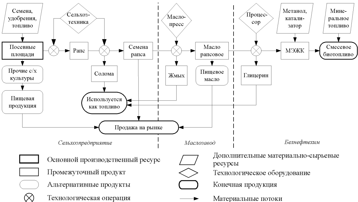
Рис. 1. Схема бизнес-процесса производства биодизельного топлива в Беларуси.

Ключевым производственным показателем на данной стадии бизнес-процесса, характеризующим эффективность использования посевных площадей, является урожайность, которая составляет по техрегламенту до 30 ц/га для ярового рапса и до 45 ц/га для озимого [13. С. 245, 256]. Урожайность высокопродуктивных сортов рапса,