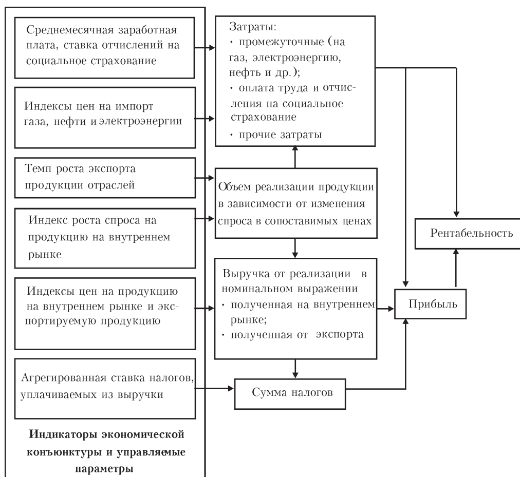
Блок-схема имитационной модели влияния основных факторов на рентабельность

Формальное описание модели. Алгоритм работы модели представлен в разрезе отрасли и описывает методику расчета каждого из показателей формул (2) и (3).