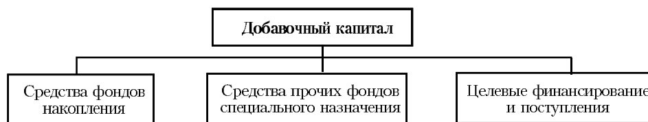
Рис. Структура добавочного капитала

Следующая составляющая собственного капитала — добавочный капитал (см. рисунок).