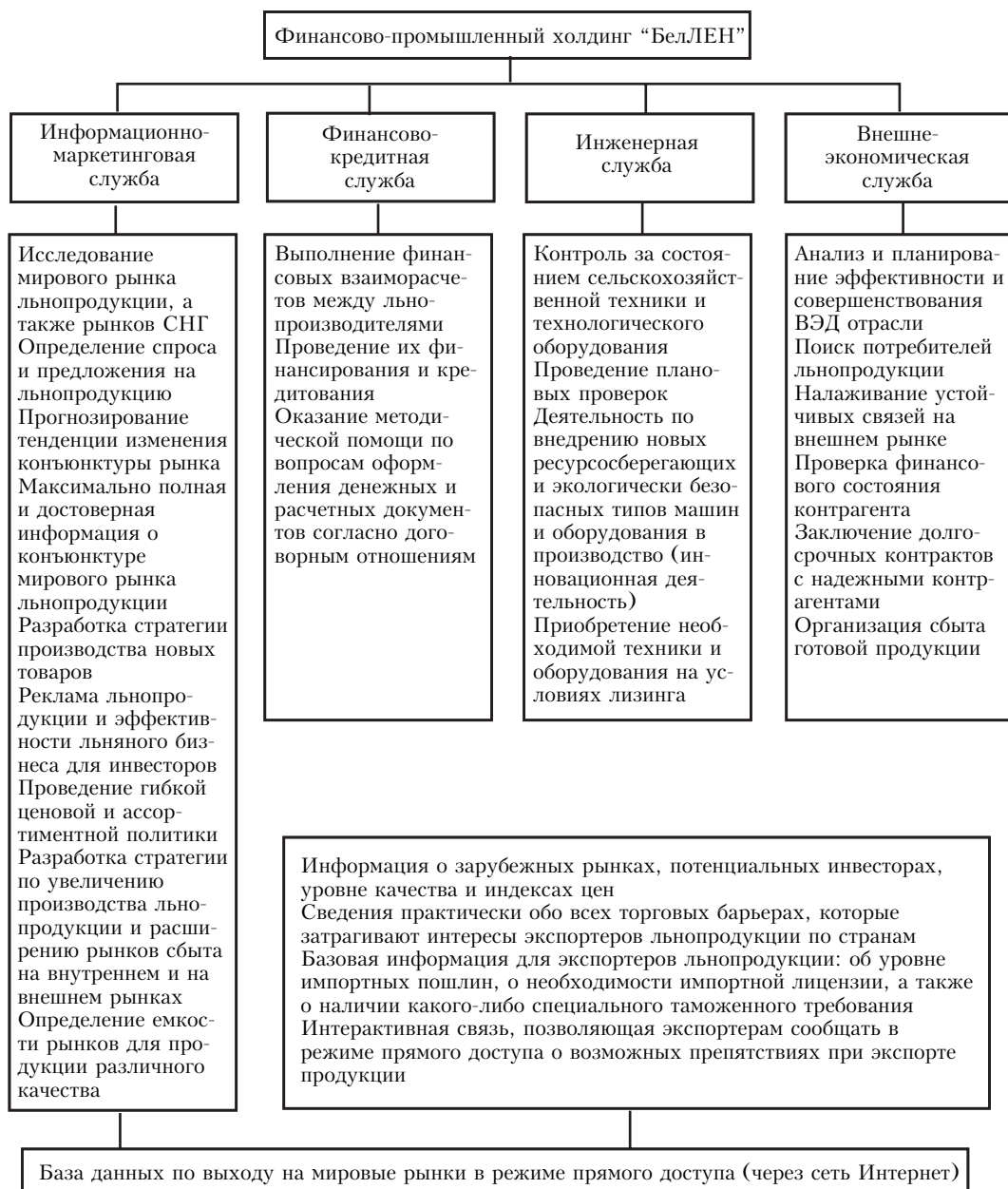
Рис. 3. Основные функции отделов ФПХ "БелЛЕН"

тивности, рентабельности, которая позволит увеличить и заработную плату, и фонд потребления предприятий.