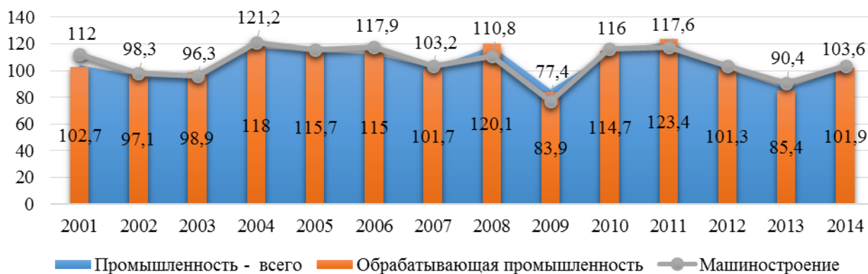
Рисунок 2 – Темпы роста объема производства промышленной продукции в Республике Беларусь

Для анализа динамики основных показателей, характеризующих инвестиционный потенциал Республики Беларусь за 2000-2015 года были использованы данные Национального статистического комитета Республики Беларусь и рассмотрены темпы роста объема производства промышленной продукции в целом, а также отрасли машиностроения.