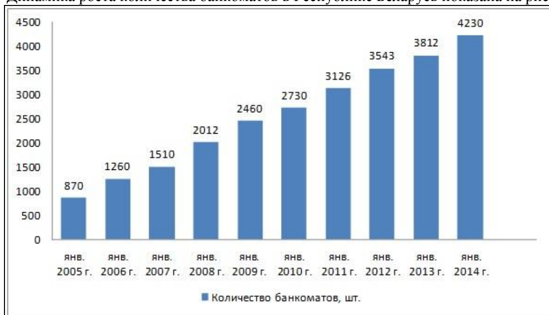
Рисунок 3 – Динамика роста банкоматов в Республике Беларусь

Динамика роста количества банкоматов в Республике Беларусь показана на рисунке 3.