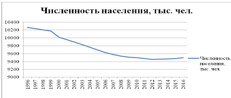
Рисунок 1 – Динамика численности населения Республики Беларусь Примечание: собственная разработка на основе [2]

Начиная с 2000-го года в Беларуси наблюдается отрицательное сальдо между рождаемостью и смертностью, что приводит к естественной убыли населения (рисунок 2). За последние 2 года разница значительно сократилась, в 2015 году убыль составила 998 человек по сравнению с 2014 годом, в которой убыль составила 3008 человек, и 2010 годом, когда показатель был равен 29082. Несмотря на сокращение смертности и увеличение рождаемости, проблема остается актуальной и по сегодняшний день. Процесс идет достаточно медленными темпами. Сказывается огромное влияние катастрофы на Чернобыльской АЭС, вызвавшей всплеск онкологических заболеваний, а также приверженность населения различным вредным привычкам и большой процент сердечно-сосудистых заболеваний. При этом в Брестской области и городе Минск наблюдается преобладание рождаемости над смертностью. Так, по данным Белстата в 2015 году коэффициент рождаемости по Брестской области составил 13,5, а смертности – 12,7. По г. Минск коэффициенты рождаемости и смертности составили 11,6 и 8,8, соответственно.