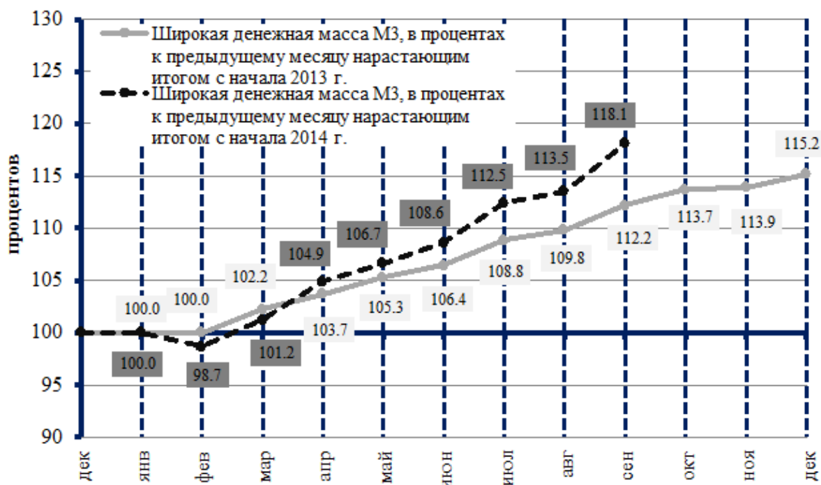
Рисунок 2 - Рост широкой денежной массы (М3) в процентах с начала года нарастающим итогом (декабрь предыдущего года = 100)

В Беларуси из года в год не выполняются прогнозные параметры по ограничению темпов роста денежной массы, устанавливаемые ежегодно в ОНДКП. Исключение составил 2013 год, при установленном прогнозируемом параметре в 19%, прирост широкой денежной массы (денежного агрегата М3) составил – 15,2 %. Все последние 10 лет, фактические темпы роста широкой денежной массы, как правило, опережали прогнозные значения. На 1 сентября текущего прирост широкой денежной массы (М3) по сравнению с уровнем на начало года составил 18,1%, что превышает значение соответствующего периода предыдущего года (12,2 %). Прогнозный параметр прироста широкой денежной массы на 2014 г. составляет 17%, поэтому вероятнее всего 2014 г. не станет исключительным, и прогнозные параметры по ограничению темпов роста денежной массы не будут выполнены (рисунок 2).