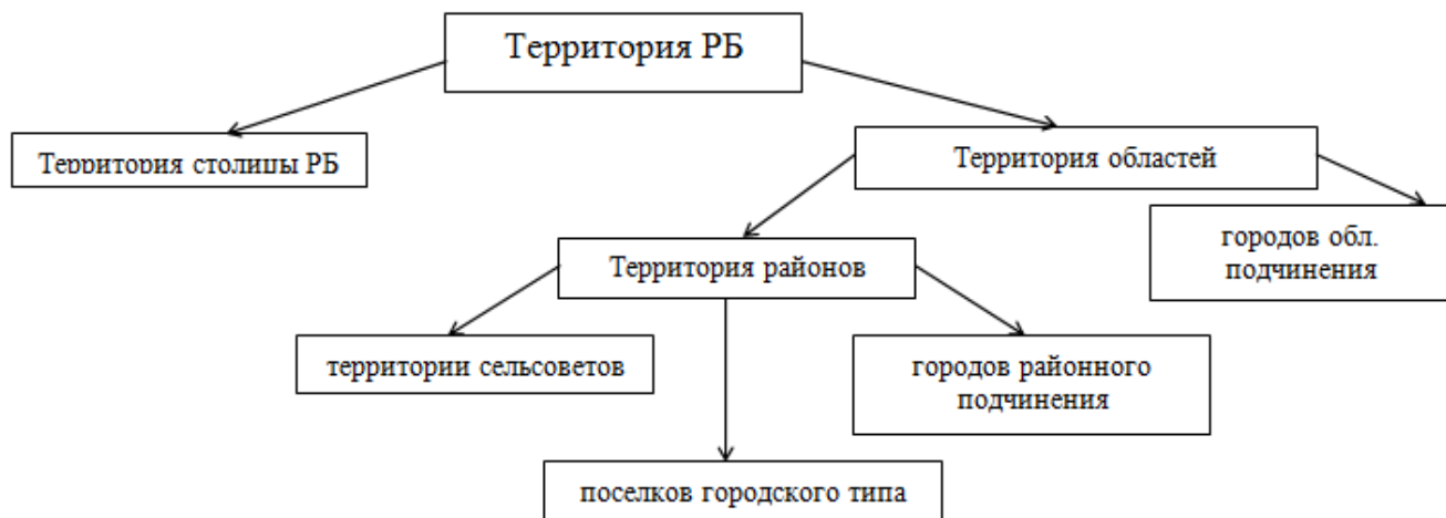
Рисунок 1 - Схема административно-территориального деления Республики Беларусь Примечание – Источник: собственная разработка на основе [2]

На данный момент территория Республики Беларусь, общей площадью 207,6 тыс. кв. км, административно разделена на шесть областей (Брестскую, Витебскую, Гомельскую, Гродненскую, Минскую и Могилевскую), которые, в свою очередь, делятся на районы. Схема административно-территориального устройства представлена на рисунке 1: