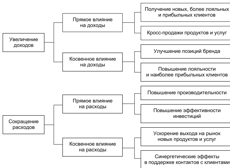
Рис. 4. Категории эффектов от внедрения CRM

Различные источники (META Group, Gartner Group, ISM и др.) выделяют основные категории эффектов от внедрения CRM (рис. 4) [8].