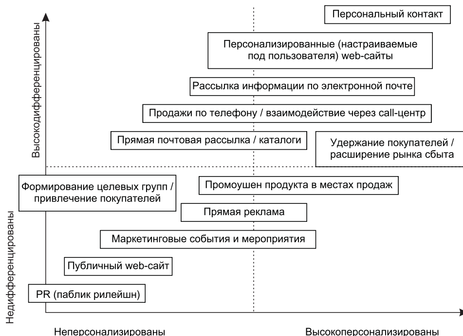
Рис. 3. Характеристика форм взаимодействия с потребителем

Современные концепции [7, 8, 9] свидетельствуют о том, что произошло смещение акцентов: если раньше клиент получал представление о компании на основании ее продукта, то теперь он строит свое отношение к компании в целом — как партнеру, с которым он взаимодействует по разным каналам — от телефонного звонка, до Интернета и личного визита. При этом запросы потребителей стали значительно более дифференцированными, а формы взаимодействия персонализированными (рис. 3).