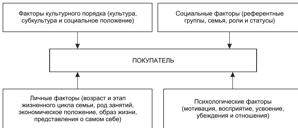
Рис. 2. Группы факторов, оказывающие влияние на поведение покупателей

Современные концепции [7, 8, 9] свидетельствуют о том, что произошло смещение акцентов: если раньше клиент получал представление о компании на основании ее продукта, то теперь он строит свое отношение к компании в целом — как партнеру, с которым он взаимодействует по разным каналам — от телефонного звонка, до Интернета и личного визита. При этом запросы потребителей стали значительно более дифференцированными, а формы взаимодействия персонализированными (рис. 3).