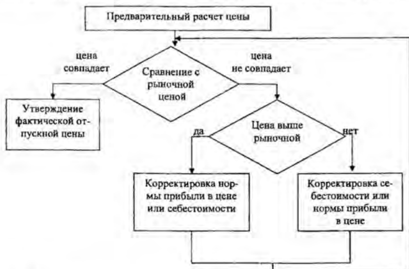
Рис. 2. Механизм ценообразования предприятий-производителей фанеры

нормативными документами, т.е. на исследуемых предприятиях при формировании цены учитываются затраты на производство, все виды установленных налогов и неналоговых платежей, прибыль и средний сложившийся на рынке уровень цен. Механизм ценообразования предприятий представлен на рис. 2.