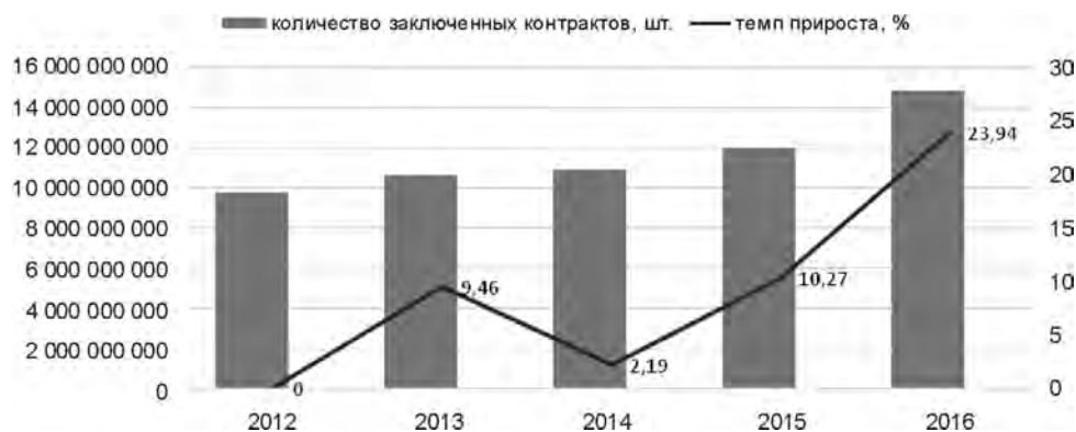
Рис. 2. Динамика количества фьючерсных контрактов в 2012–2016 гг., %