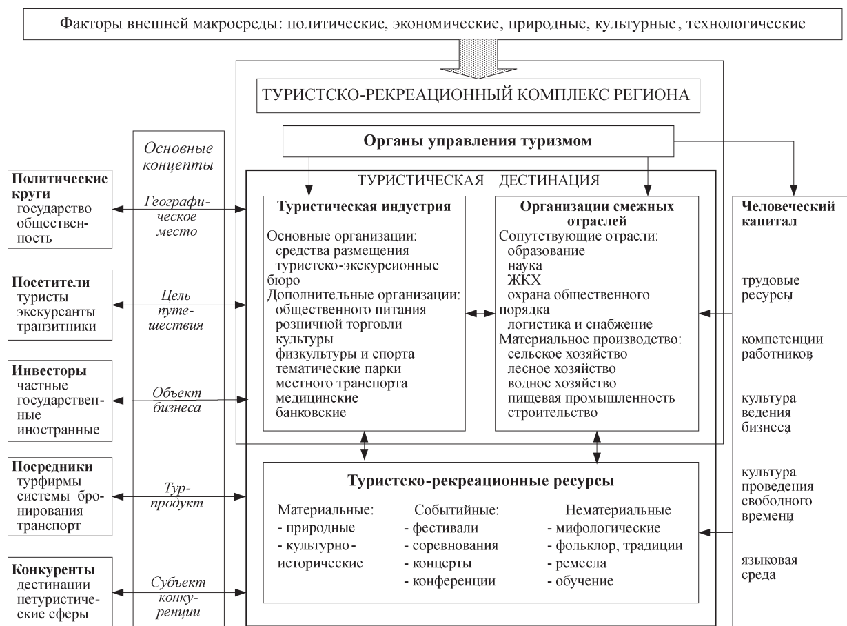
Рис. 1. Туристическая дестинация как экономическая система