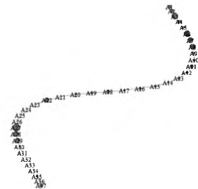
Рис 2. Анализ маршрута № 59

По полученному изображению видно, что распределение маршрутов данной сети абсолютно неравномерно, на некоторых участках только один маршрут, на некоторых 6–7 маршрутов. Возникает острая необходимость в пересмотре данного маршрута: разгрузка перегруженных участков (Торайгырова, Токтабаева, Энерготехникум, Автовокзал Сайран, Розыбакиева, проспект Гагарина, Автовокзал Саяхат) и запуск дополнительных малогабаритных автобусов в часы пик на недостающих участках.