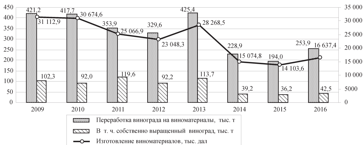
Рис. 3. Динамика переработки винограда и производства виноматериалов

• объем переработки винограда на виноматериалы за исследуемый период сократился на 38,7% (со 198,1 до 121,5 тыс. т), однако в пределах Украины составляет