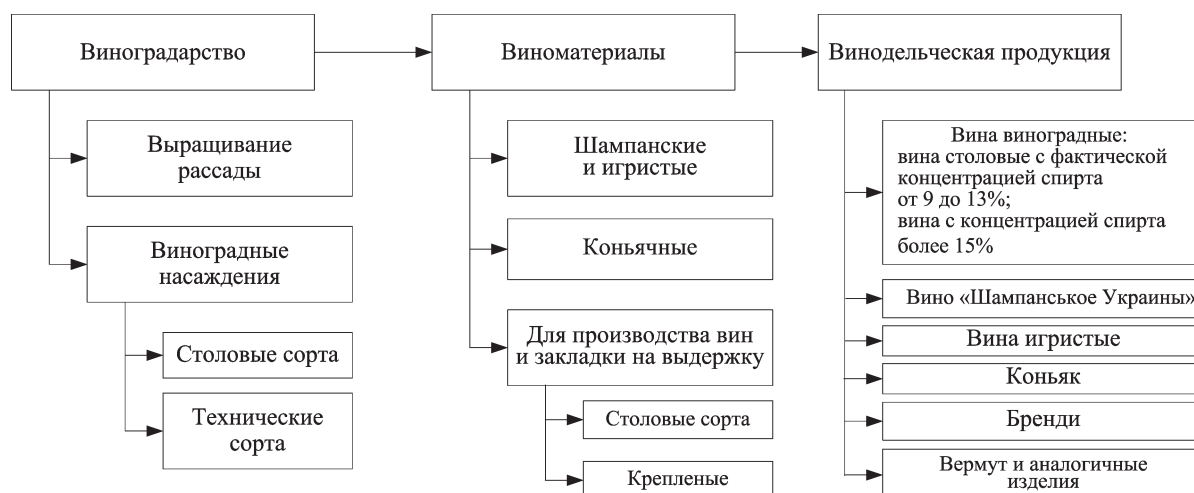
Рис. 2. Технологические этапы винодельческого производства