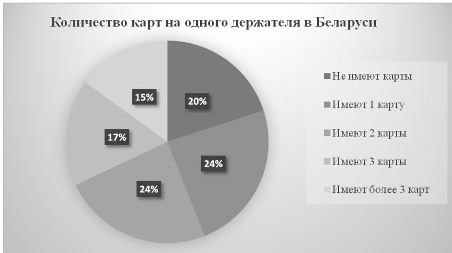
Рисунок 2 – Количество банковских карт на одного держателя по Республике Беларусь

Практически половина населения Республики на сегодняшний день пользуется одной либо двумя платежными карточками одновременно, около 15% (а это примерно полтора миллиона жителей) имеет во владении более 3 платежных карт (рисунок 2).