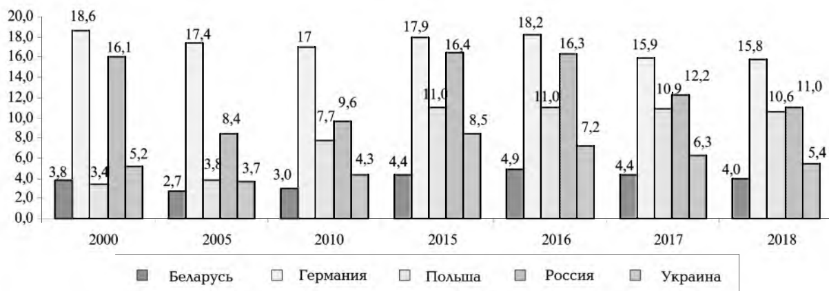
Рис. 1. Экспорт высокотехнологичной продукции, % от экспорта товаров