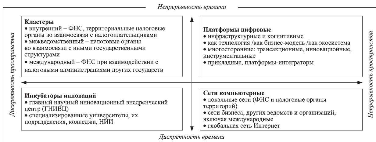
Рис. 1. Агрегат кластеров, платформ, сетей и инкубаторов: налоговый аспект

Наименования представлений (разрезов, образов) содержательной части ГМНЭ и виды обеспечения (инструменты) обозначаются на рис. 2.