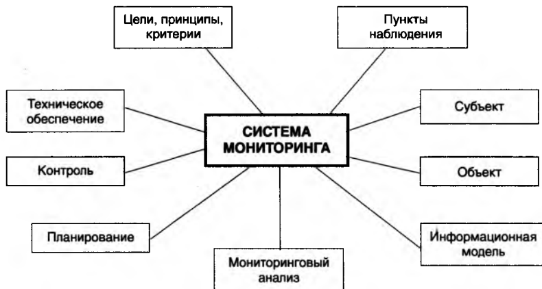
Рис. 1. Система мониторинга поддержки и развития малого предпринимательства в Республике Беларусь.