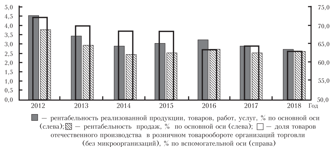
Рис. 2. Сопоставление динамики основных показателей рентабельности основной деятельности субъектов в сфере розничной торговли (за исключением торговли автомобилями и мотоциклами) и доли товаров отечественного производства в розничном товарообороте организаций торговли (без микроорганизаций) за 2012–2018 гг.

Деятельность торговых организаций в последние годы характеризуется сокращением рентабельности (рис. 2). Коэффициенты парной корреляции между долей товаров отечественного производства в розничном товарообороте организаций торговли (без микроорганизаций) и показателями рентабельности реализованной продукции, товаров, работ, услуг, а также рентабельности продаж по данной сфере составили 0,73 и 0,70 соответственно, что согласно шкале Чеддока свидетельствует о наличии высокой прямой связи между рассмотренными индикаторами.