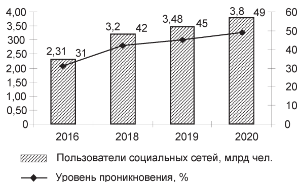
Рис. 3. Количество пользователей социальных сетей в мире в динамике