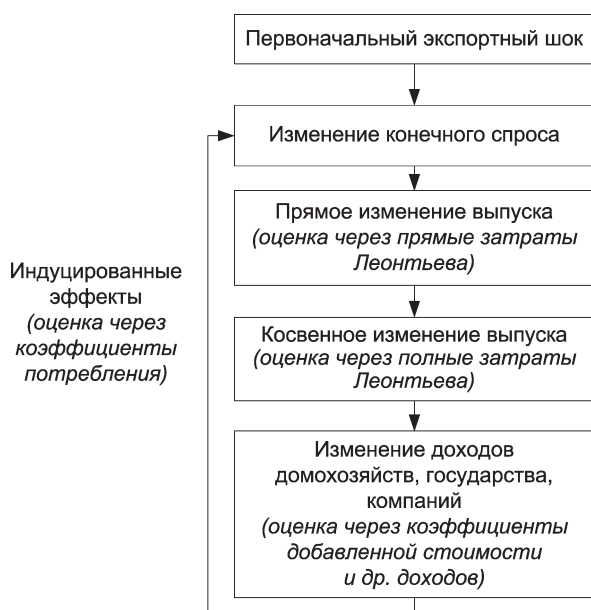
Рис. 1. Общая логическая схема методики расчетов