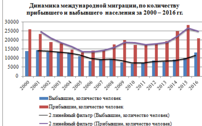
Рисунок 1 – Динамика международной миграции, по количеству прибывшего и выбывшего населения за 2000 – 2016 гг.

увеличением, хотя общий тренд увеличения данного показателя прослеживается. В 2016 году данный показатель был вдвое больше его значения в 2010 году и составил более 13 тыс. человек. Такая ситуация может объясняться тем, что в большинстве случаев эмигрируют из стран с более низким уровнем индекса человеческого развития (ИЧР) в страны с более высоким. В данном случае, Беларусь в 2015 г. по индексу человеческого развития (0,796) занимала 52-е место среди 188 стран и относилась к группе государств с высоким уровнем человеческого развития, опередив все страны СНГ, кроме России (49-е место). Соответственно, при создании в Беларуси благоприятных условий можно рассчитывать на привлечение трудовых мигрантов из этих стран.