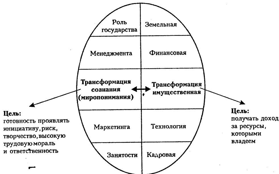
Рис. 2. Области трансформации

Классифицируя области трансформации аграрного хозяйства, можно выделить две как самые крупные, которые содержат несколько составляющих: трансформацию сознания и трансформацию имущественную (см. рисунок 2).