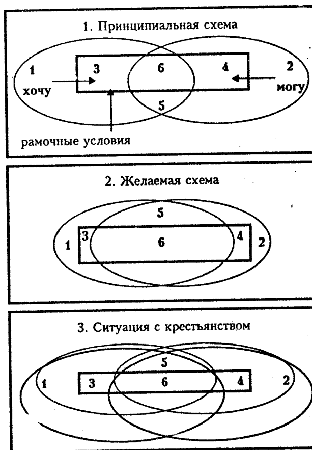
Рис.1. Принципиальная, желаемая и фактическая ситуация компромисса желаний, возможностей хозяйствующего на земле человека и роль рамочных условий хозяйствования

Иллюстрируя этот тезис, я предлагаю читателю порассуждать над рисунком 3, где схематично показаны варианты соотношения естественных для человека вещей: желаний и возможностей, а также роль рамочных условий хозяйствования (правил, дозволений, предписаний и запретов), которые устанавливаются властями.